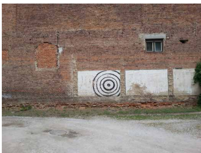
a bejárati kapu felől is meghatározó látványt nyújtó impozáns TŰZFALUDVAR