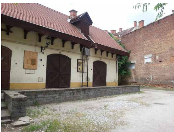
a galéria hátsó épületrésze melletti, a galériával szoros kapcsolatban lévő GALÉRIAUDVAR