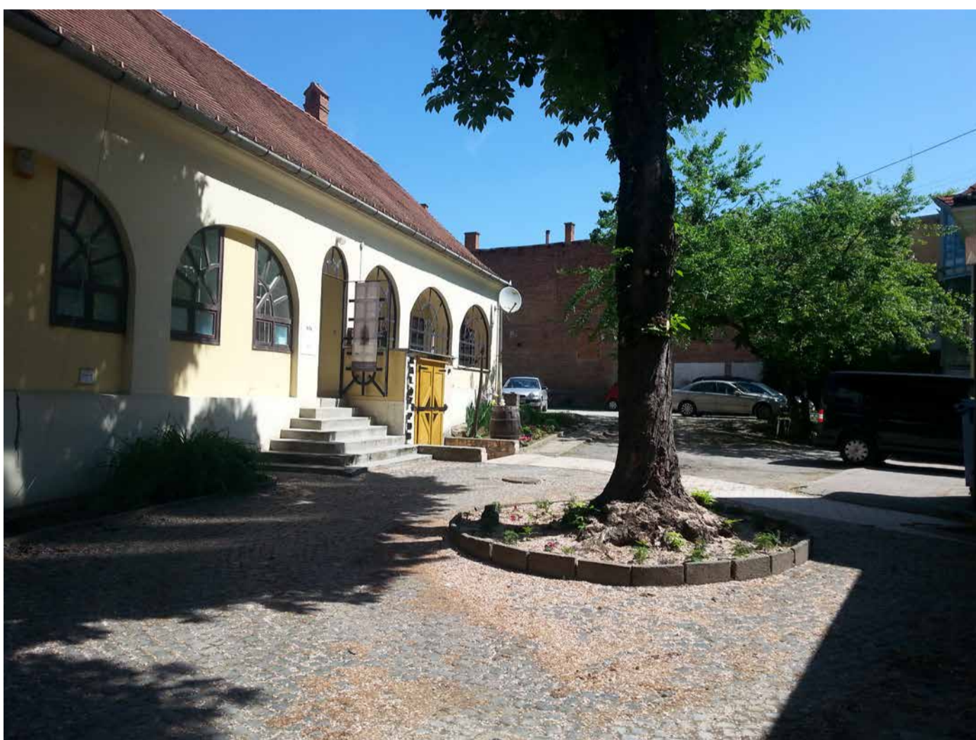
a bejárati kapu utáni nagy gesztenyefa környezete mint FOGADÓTÉR